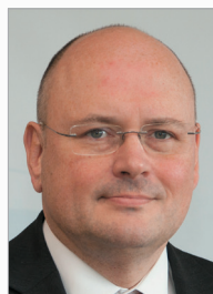
Arne Schönbohm Präsident des BSI